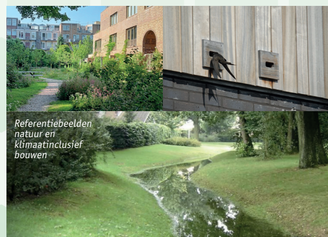
Referentiebeelden natuur en klimaatinclusief bouwen