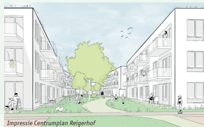
Impressie Centrumplan Reigerhof