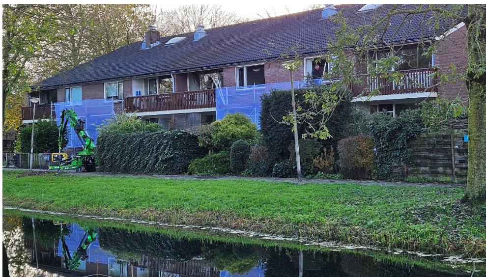
Werkzaamheden aan de Ambachtsdreef/Dijkgraafaan in Oudewater

Vanwege procedures (Flora en Fauna) zijn een aantal werkzaamheden doorgeschoven naar 2024. Nu deze werkzaamheden zijn afgerond, zijn de meeste woningen met een rood energielabel verbeterd. Over het algemeen hebben onze woningen nu energielabel A, B, C of D. Bij 5 woningen zijn er technische knelpunten. 3 bewoners op leeftijd willen geen werkzaamheden meer uit laten voeren.